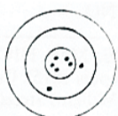
SCHULENBERG – 33