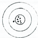
PARTRIDGE – 34